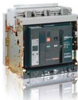
Merlin Gerin Masterpact NW