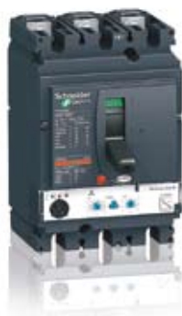
Merlin Gerin Compact