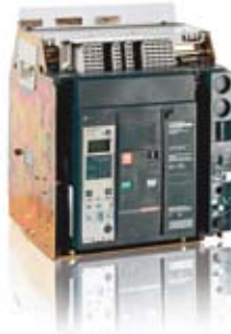
Merlin Gerin Masterpact NT